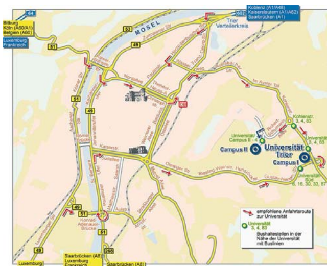
(Anfahrt zur Universität)