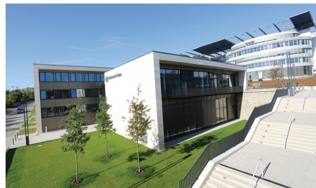
Tagungsort: KSW Neubau, Gebäudeteil A, Raum 4+5

Weitere Informationen zur Tagung finden Sie im Netz: www.fernuni-hagen.de/soziologie/lg1/fachtagung2013/